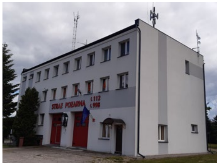
System powiadamiania i alarmowania ludności oraz zintegrowanej łączności