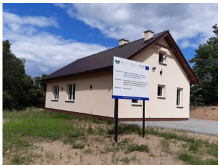
Świątlica w Jeleńcu