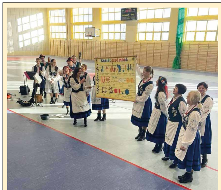
► Zespół Folklorystyczny „Modraki”, który działa przy GCKiB w Parchowie promował nasz region, kulturę i tradycje w województwie wielkopolskim. Nasi artyści odwiedzili m.in. Szkołę Podstawową w Zdziechowiu w gm. Gniezno.

Sëllęczëno, Zespół Folklorystyczny „Modraki” z Parchowa oraz Zespół Liarman. Muzyczną ucztę okrasila ekspozycja Fundacji „Nasza Przestrzeń” z Gdańska, której artystki zaprezentowały prace wykonane w technice filcu pn. „W działaniu twórczym wszystko może się wydarzyć”. Ekspozycja pozostanie w GCKiB Parchowo do Świąt Bożego Narodzenia. Dziękujemy Paniom z KGW Parchowo za przygotowanie poczęstunku na tę okoliczność. Zdjęcia oraz wideo z tego wydarzenia publikujemy m.in. na profilu społecznościowym @GCKiBParchowo.